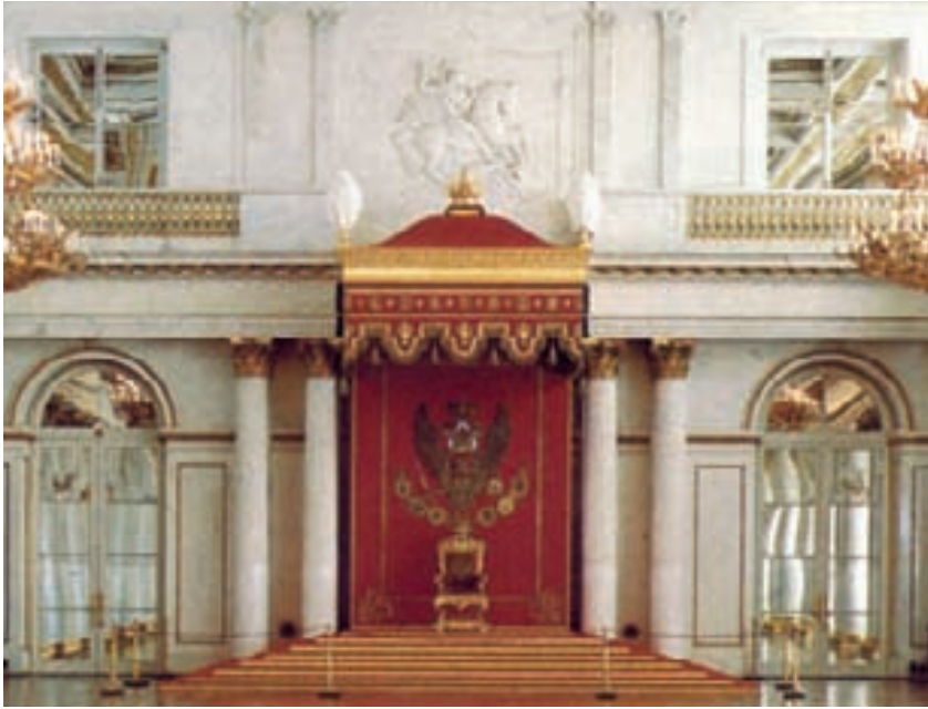
la sala reale di San Pietroburgo con il bassorilievo raffigurante San Giorgio