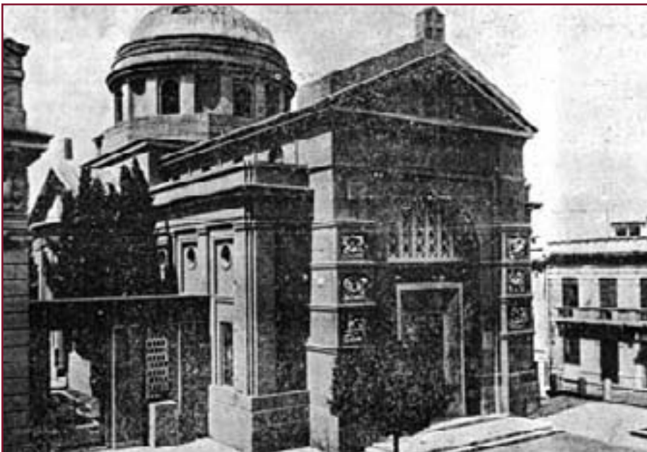
San Giorgio Intra o Tempio della Vittoria