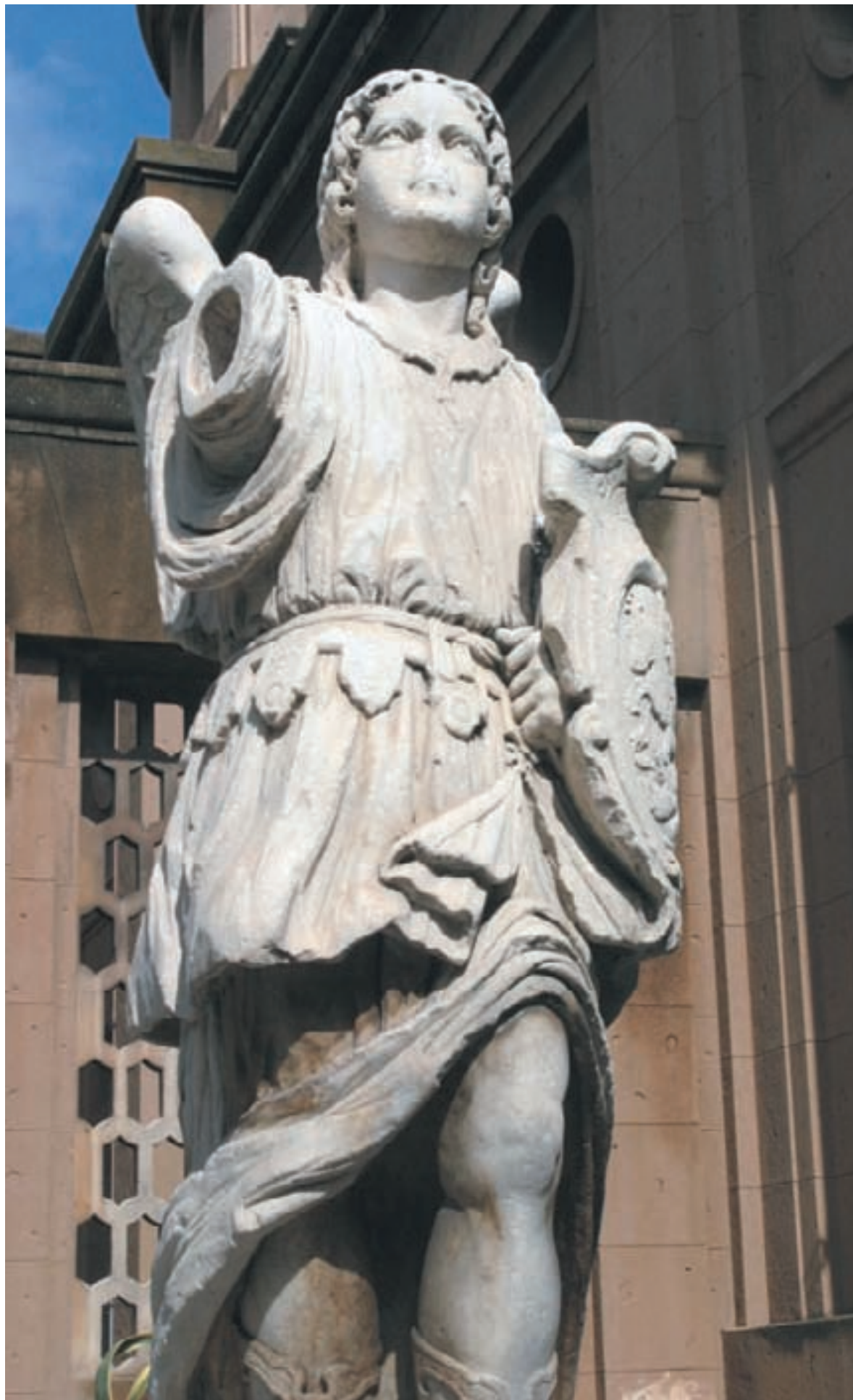
la statua seicentesca dell'Angelo Tutelare, sulla piazzetta antistante San Giorgio Intra