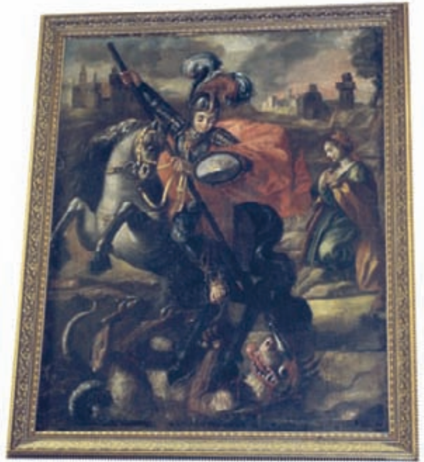
l'antico quadro di San Giorgio nella parrocchiale di San Giorgio Extra