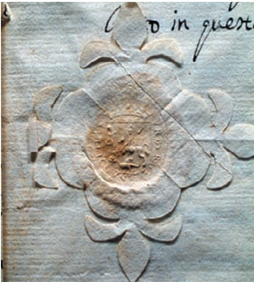
il magnum sigillum riportato nell'onciario del 1745