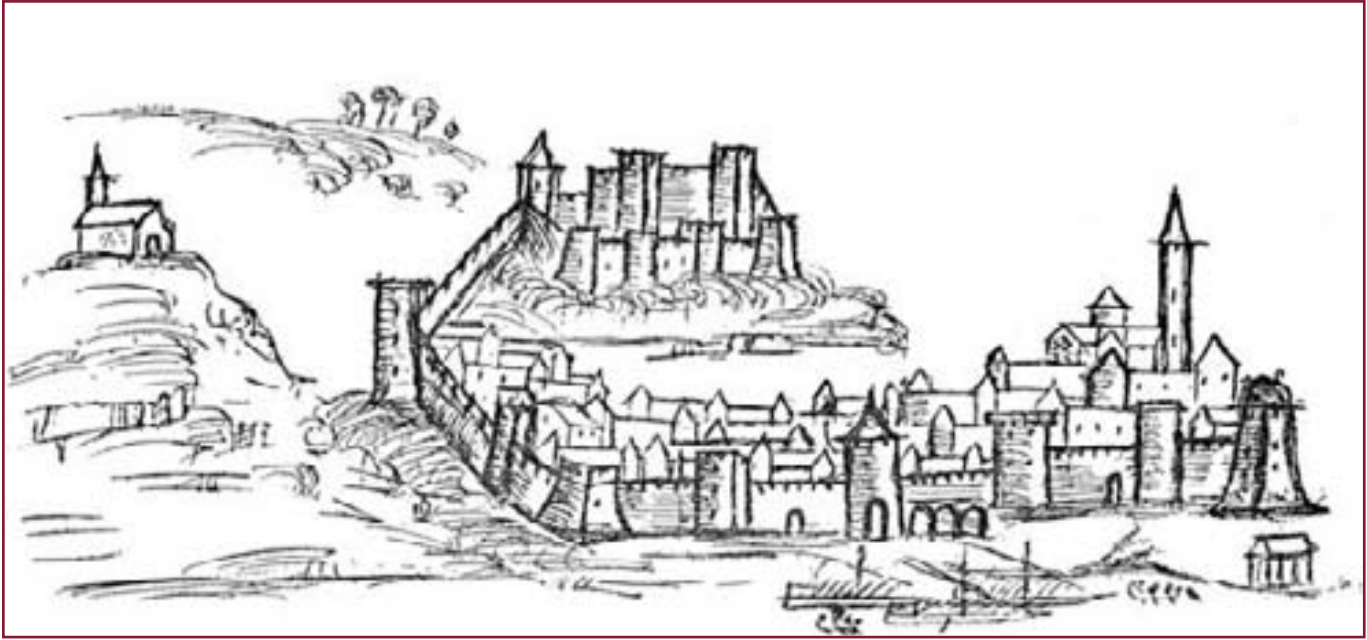
la città di Reggio dopo il saccheggio operato dai Turchi nel 1543