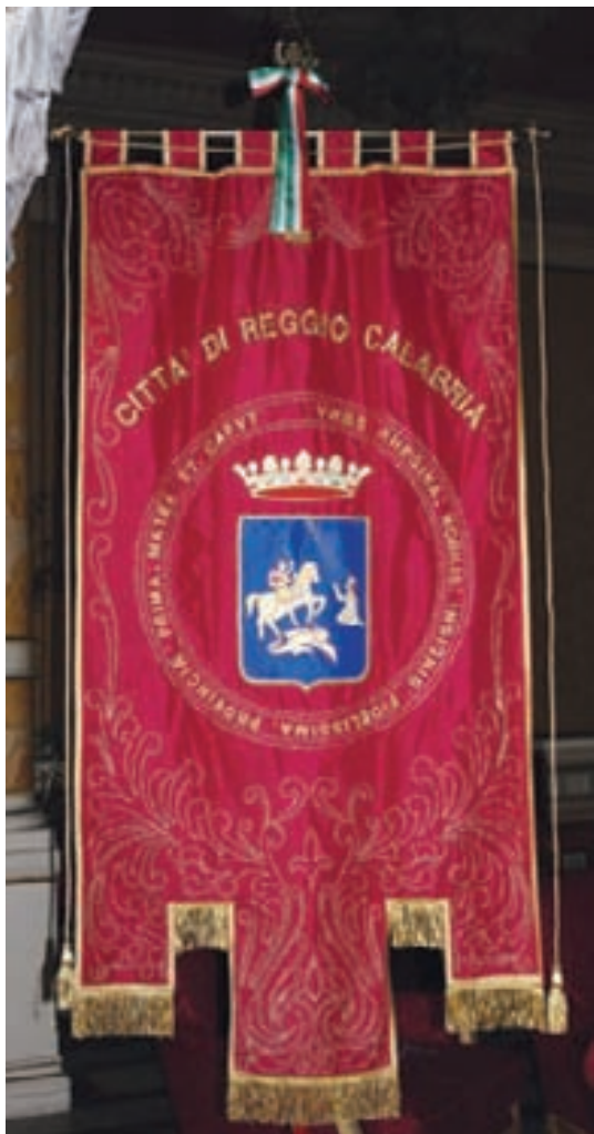
il Gonfalone della Città