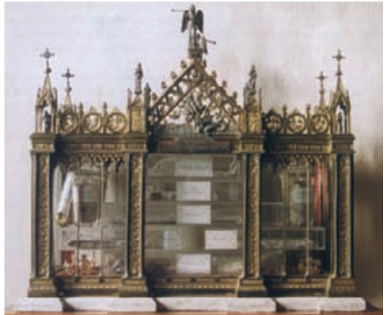
il reliquario della Basilica di San Giorgio in Borgo Vico a Como (da A. Pesenti, "San Giorgio Martire" )