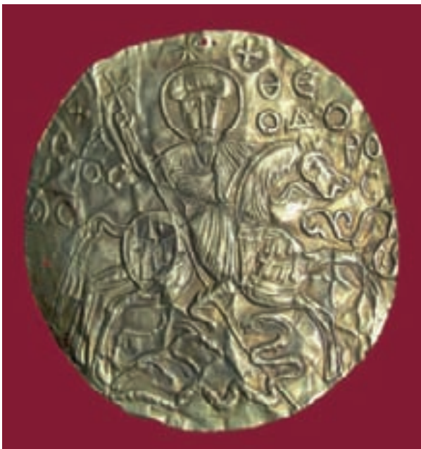
blatta aurea con San Teodoro, da Rossano (CS), IX secolo