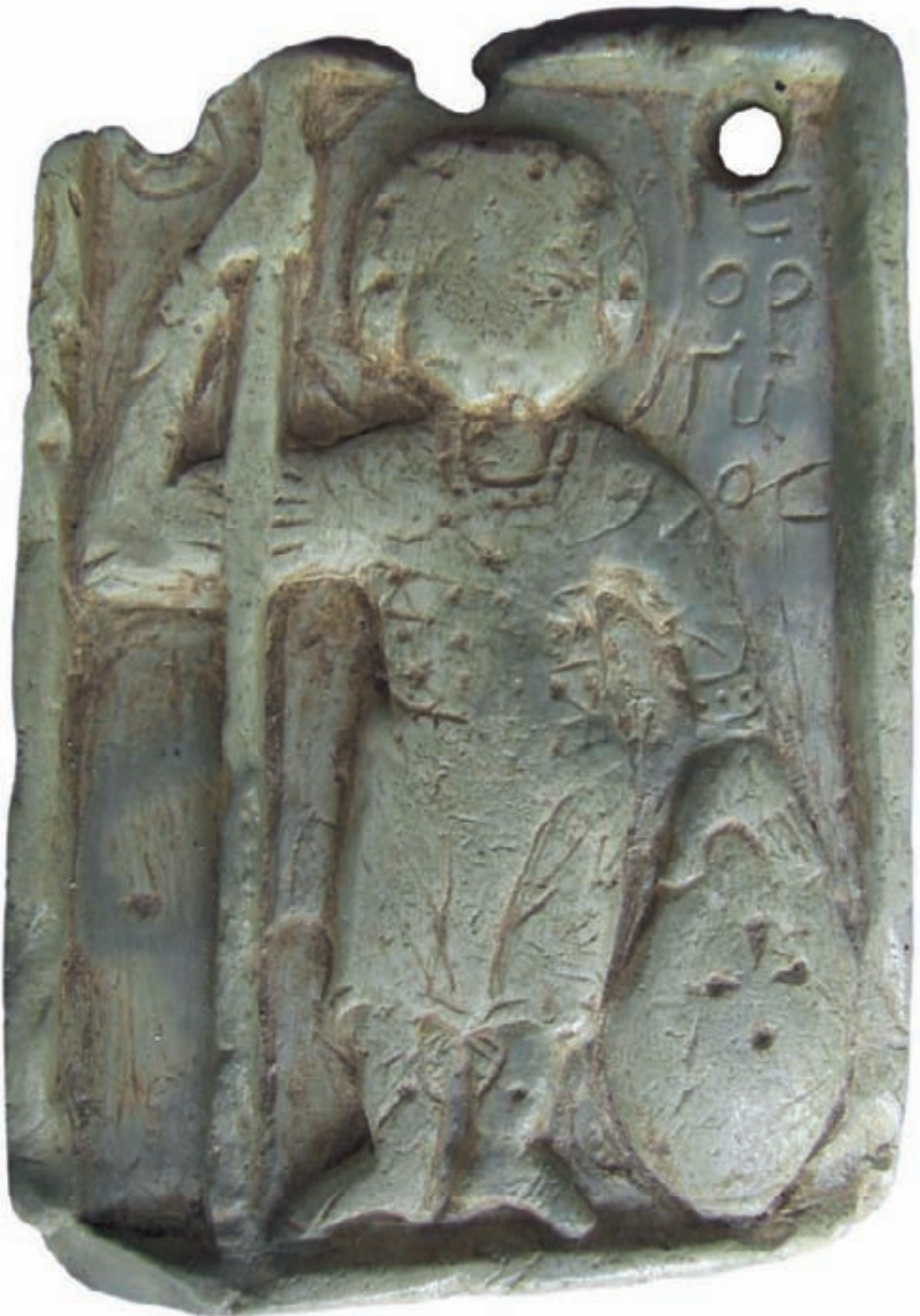
l'amuleto di Calanna