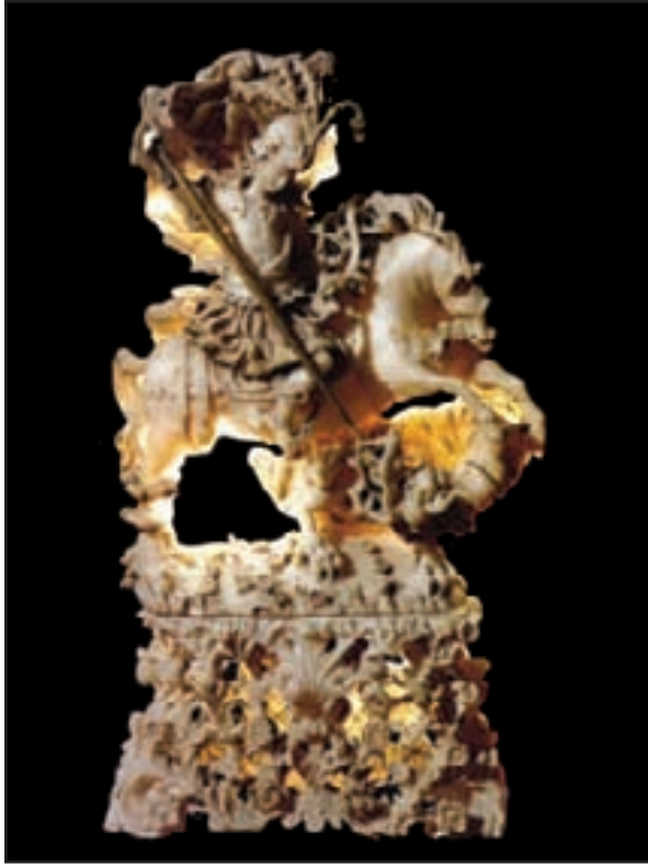
da "Immagini di Caccamo": statua di San Giorgio in alabastro del XVIII secolo