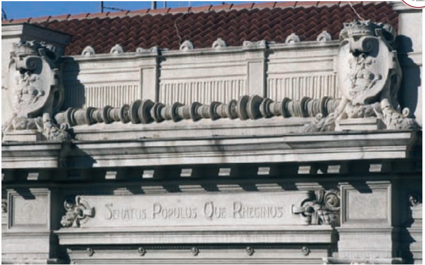
stemmi sul frontone del Palazzo Comunale, lato Corso Garibaldi