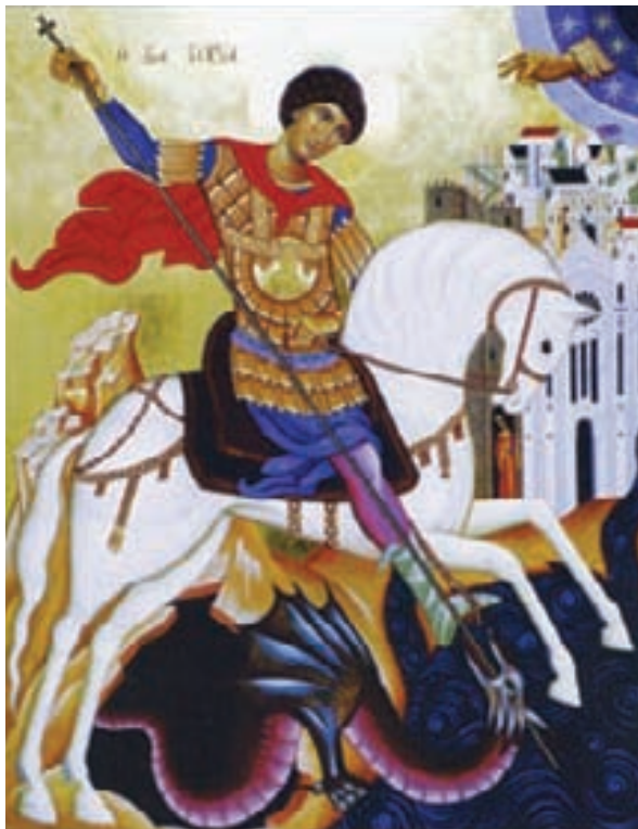
il nuovo quadro di San Giorgio nella parrocchiale di San Giorgio Extra